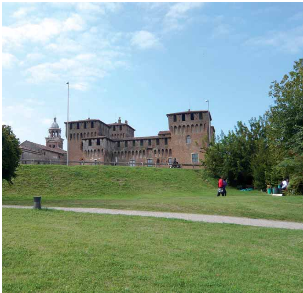
Castello San Giorgio di Mantova