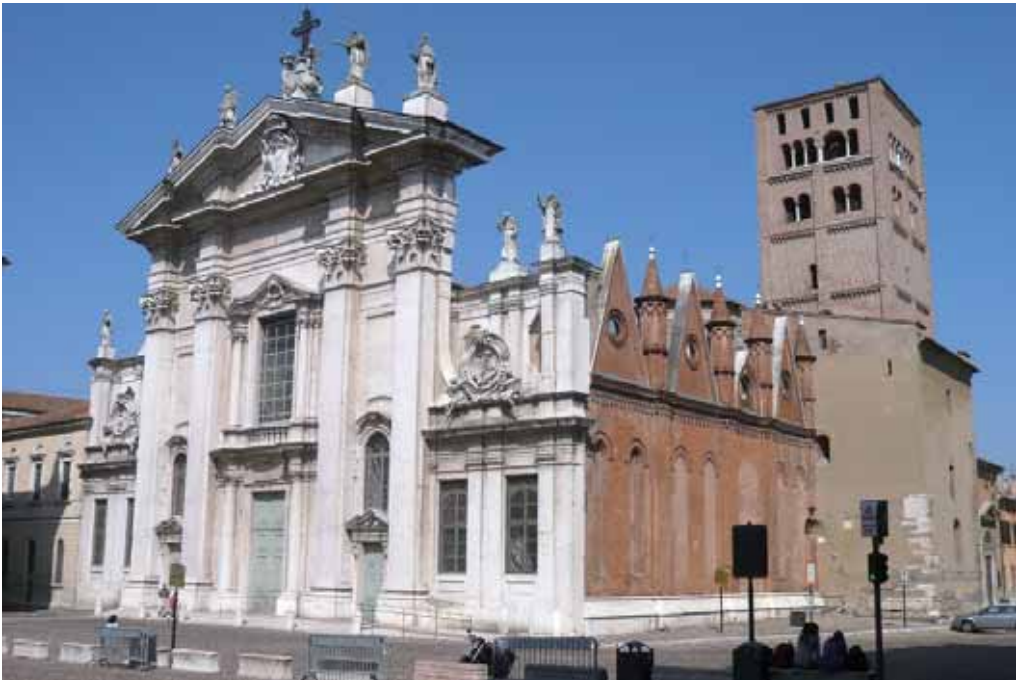
Duomo di Mantova