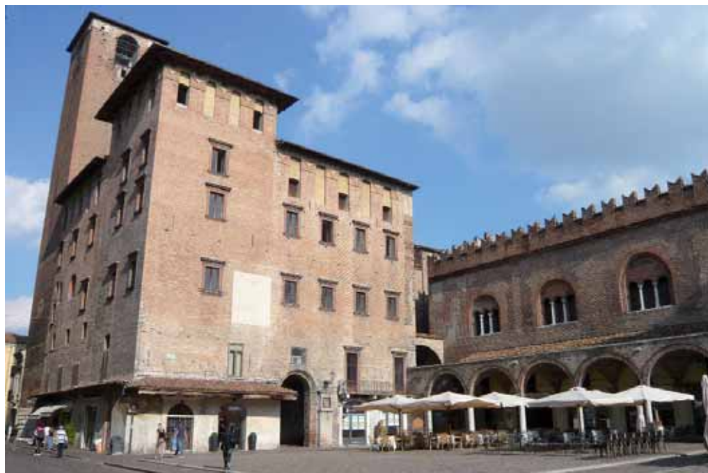
Piazza delle Erbe