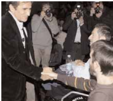
Il messaggio di Alex Zanardi, ospite di un convegno al teatro Cavallerizza di Reggio Emilia.

In occasione del lancio del nuovo Maggiolino, Volkswagen Firenze ha messo all'asta per beneficenza nel 2010 questo modello, decorato dall'artista Francesco Cuomo, per sostenere il progetto Bimbingamba di Alex Zanardi.