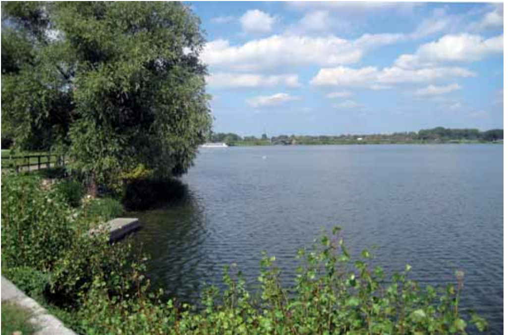
Lago inferiore