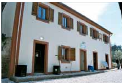
Casa di accoglienza "Niccolò Campo" presso l'Ospedale Pediatrico Apuano di Massa

Se non è competenza di nessuno prendersi cura di loro e le famiglie non hanno la possibilità economica di provvedere alle necessità di questi "piccoli", chi può aiutarli?