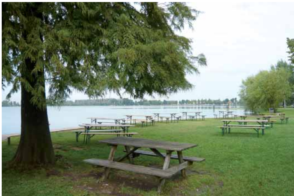
Area picnic lungo il Lago Superiore