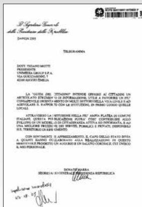
Riproduzione fotostatica ridotta del telegramma del Segretario Generale della Presidenza della Repubblica, adesione alla Guida del Cittadino tramite lettera di gradimento del 03/07/2007.