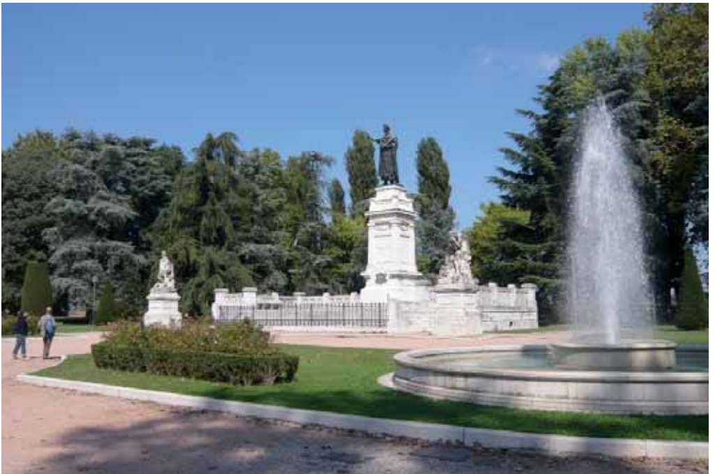
Piazza Virgiliana