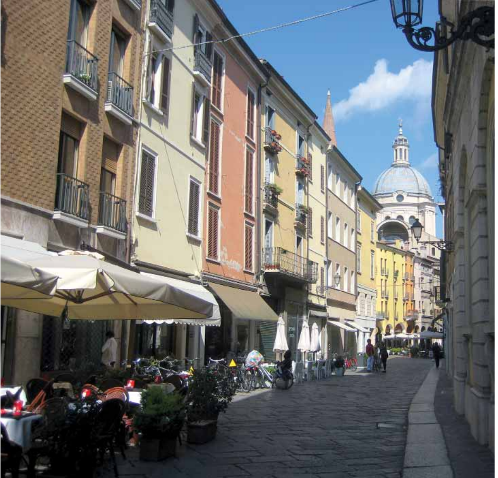
Centro storico