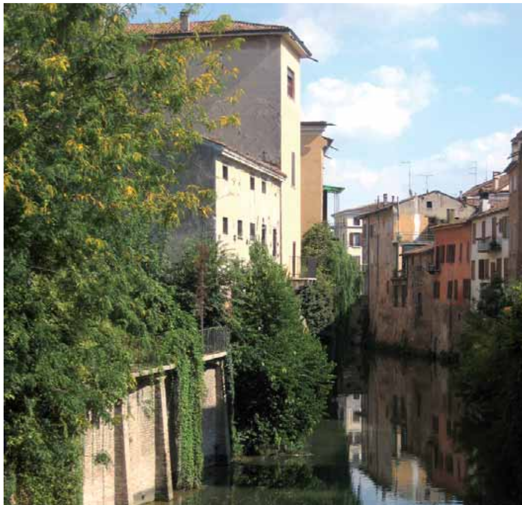
Canale del Rio