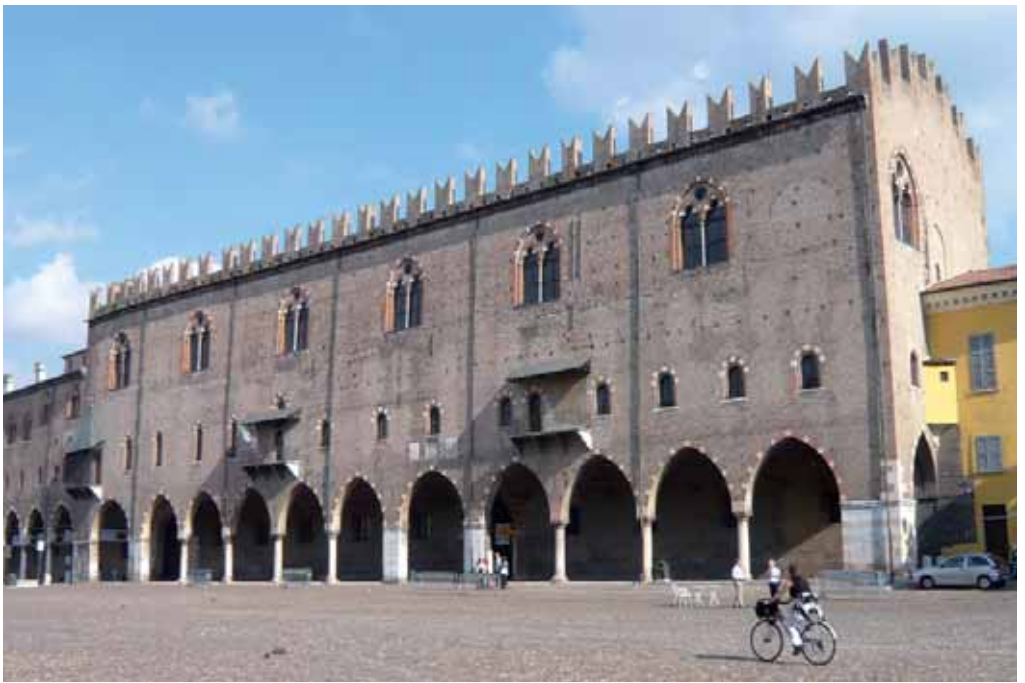
Palazzo Ducale