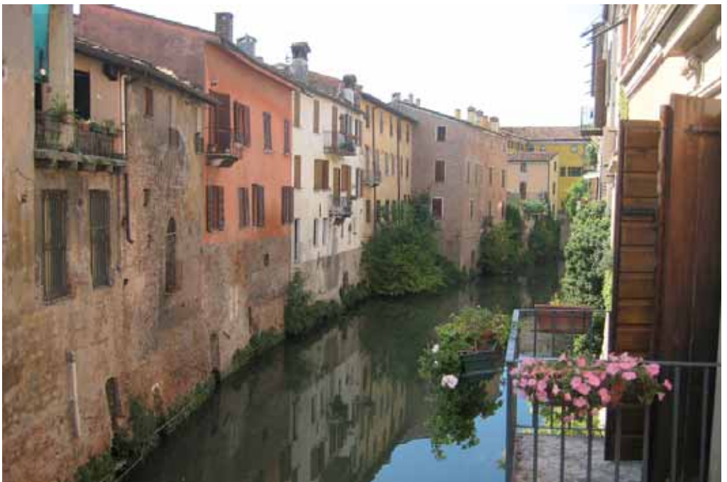
Canale del Rio