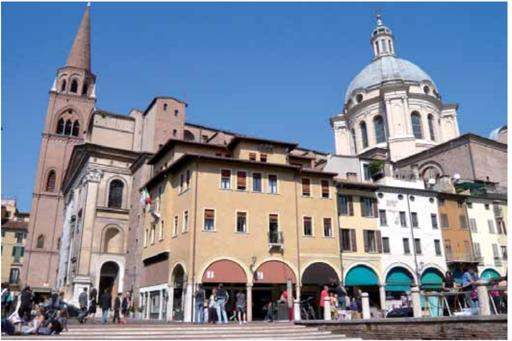
Basilica di Sant'Andrea