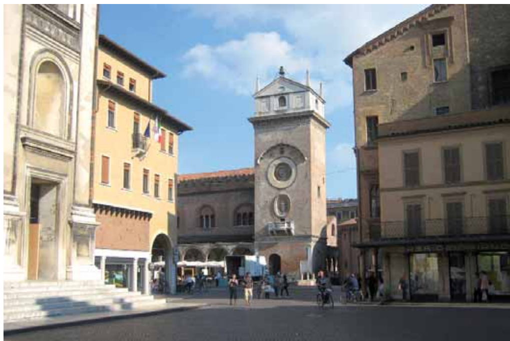
Piazza Mantegna