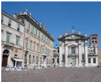
Piazza Sordello e Duomo