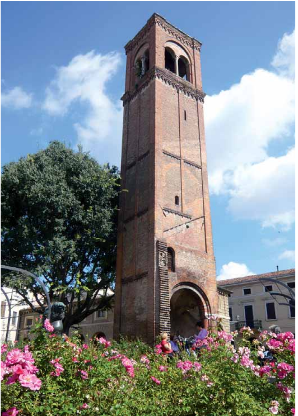
Torre di San Domenico